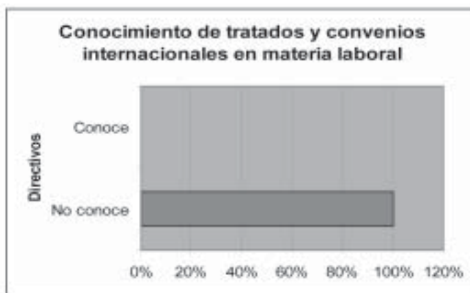
GRÁFICA 1. ¿CONOCE USTED ALGÚN CONVENIO O TRATADO INTERNACIONAL FIRMADO POR MÉXICO EN MATERIA LABORAL?

Véase el apartado "Metodología", supra , pp. 164-166.