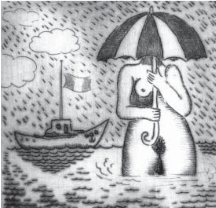
Mujer paraguas (2001). José Luis Calzada