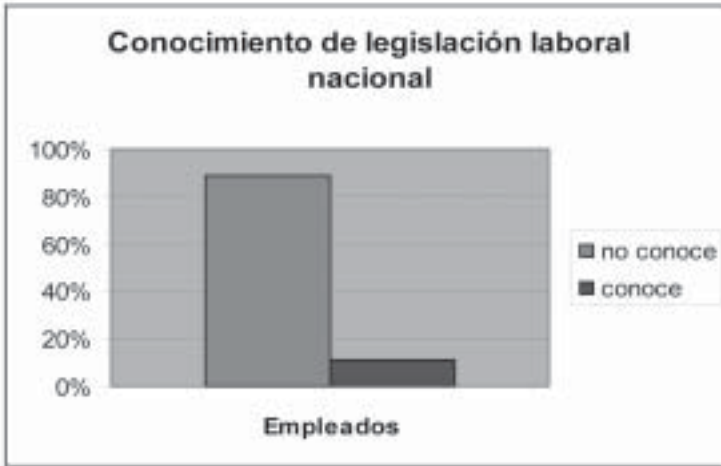
GRÁFICA 4. ¿CONOCE USTED ALGUNA LEY O NORMA LABORAL MEXICANA?

Véase el apartado “Metodología”, supra , pp. 164-166.